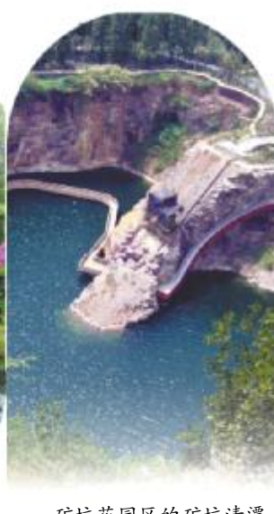
矿坑花园区的矿坑清潭