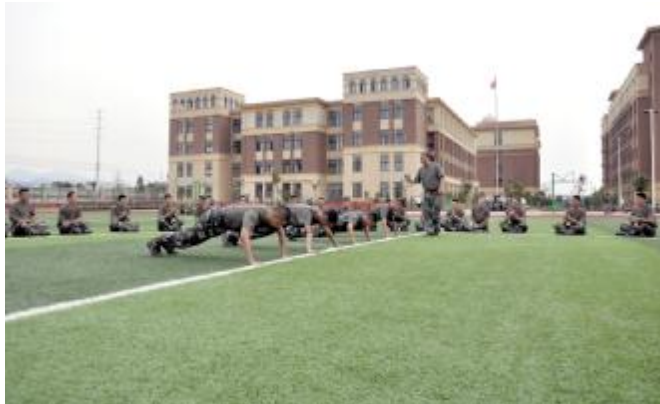
休息间隙俯卧撑比赛