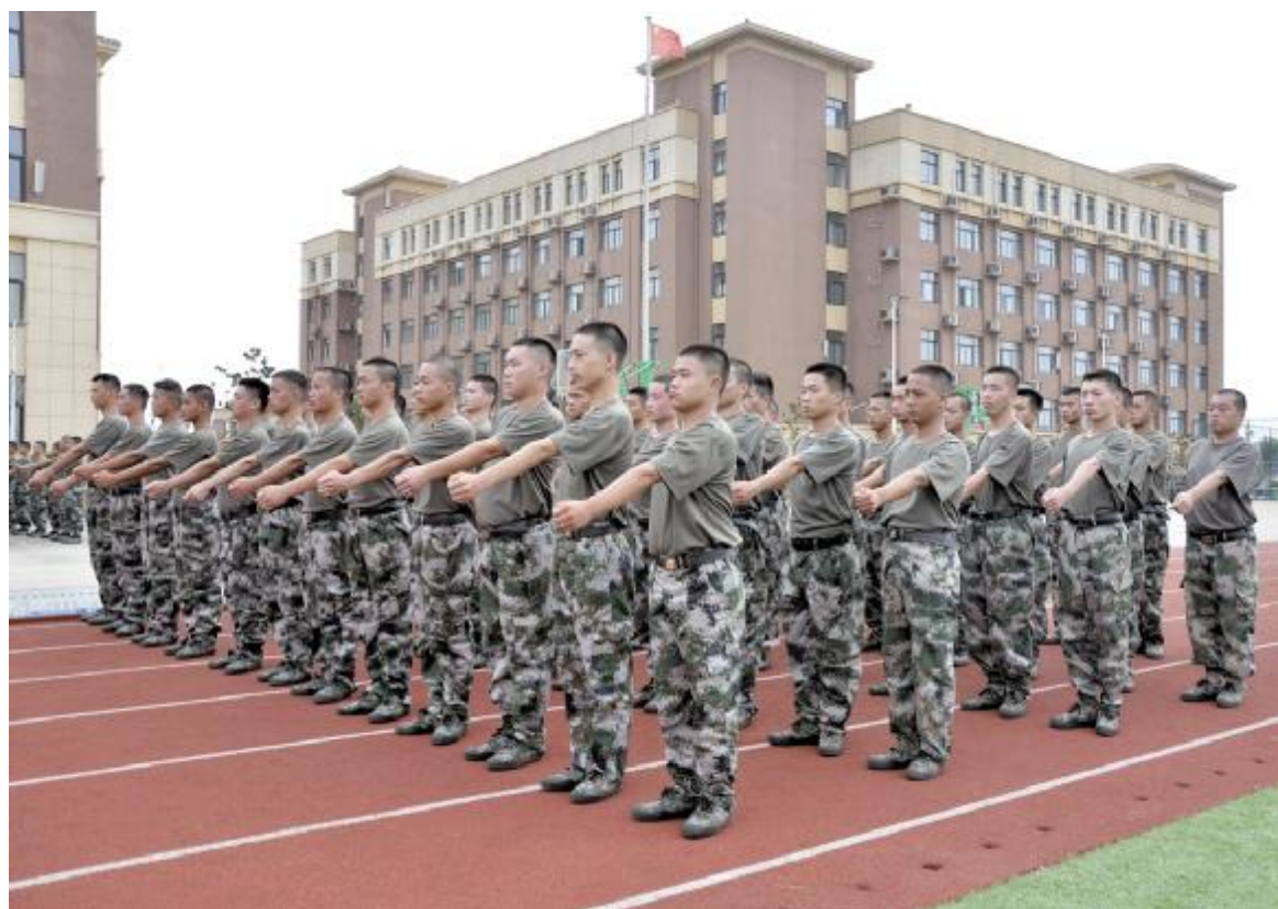
挥臂练习，保持整齐