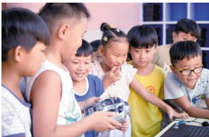
在创客空间一展身手