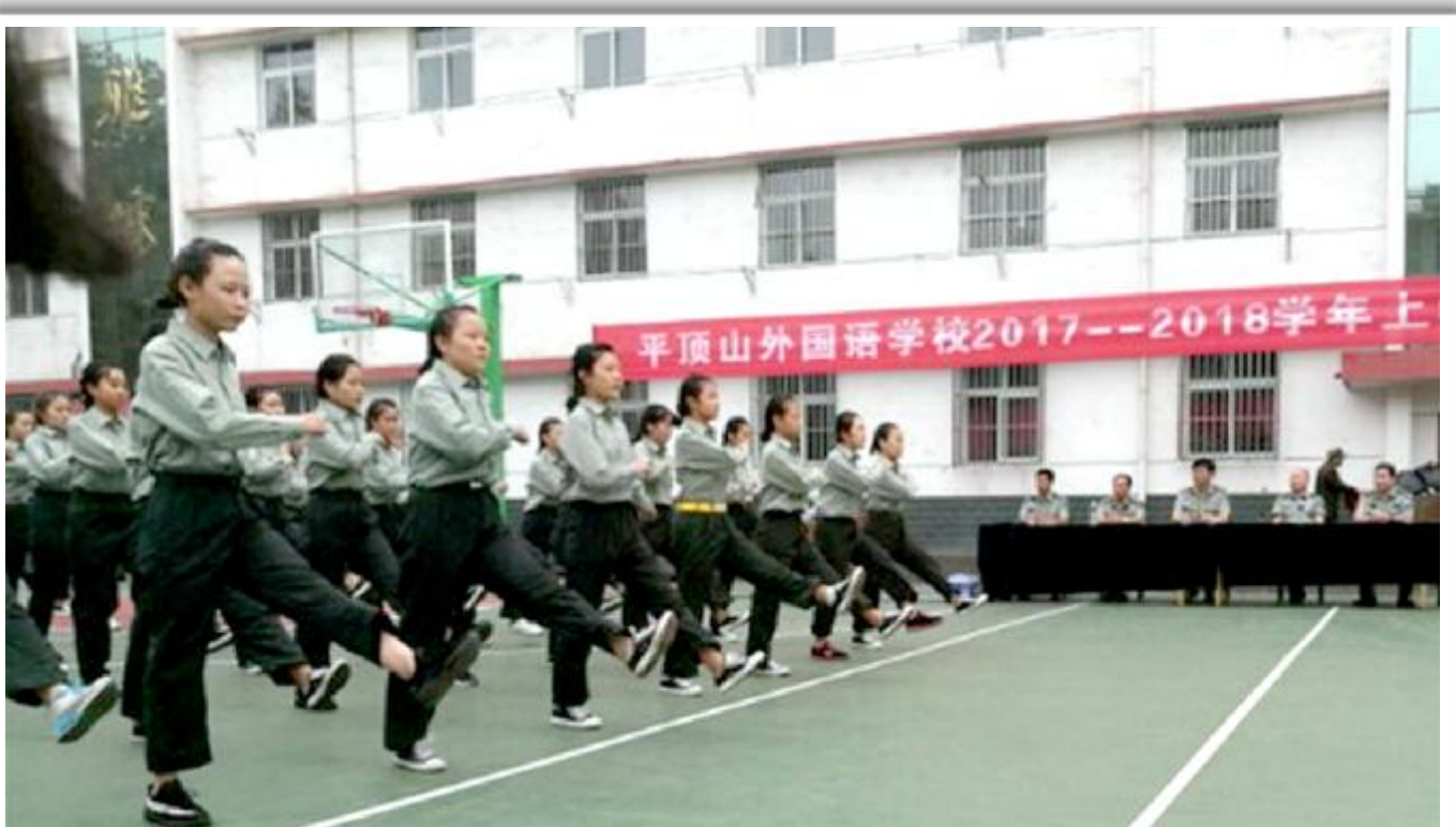
近日,平顶山外国语学校举行2017年新生军训成果汇报表演,学生们展示了站军姿、原地三面转法、齐步走、跑步走、内务整理等军事基本素质和能力,通过军训培养学生的团队精神和集体荣誉感,增进学生的纪律观念,提高综合素质。

当法院干警通知郭某前来法院领款时,郭某表示其正在医院住院治疗,不能前来领款,考虑到郭某已年过七旬,且正在住院,王光辉等人遂将9万元案件款送到焦某病床前。