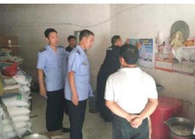
8月29日,市工商局联合各工商所、环保所工作人员到其辖区营业的店铺中,持续有效推进清洁煤、洁净型煤推广工作。