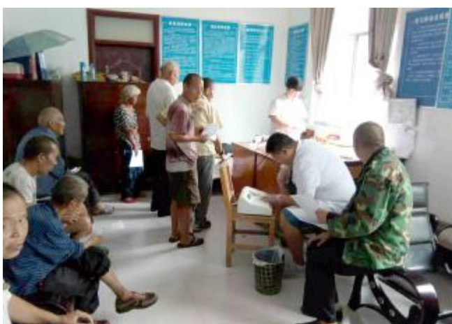
近日,市金博大医院到大峪镇敬老院为老人们进行免费健康体检,并为他们建立健康档案。