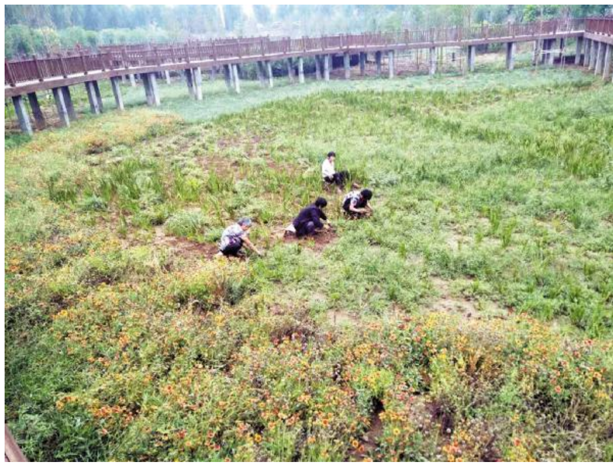
9月4日，按照创建国家园林城市工作要求，曲圣苑游园、南环游园、西环路游园、翰林游园、人民公园、梅园、文峰游园内园林工人齐上阵，清除杂草、死树并及时补种，消除黄土裸露，确保周边环境干净整洁。图为工作人员在文峰游园内除草。