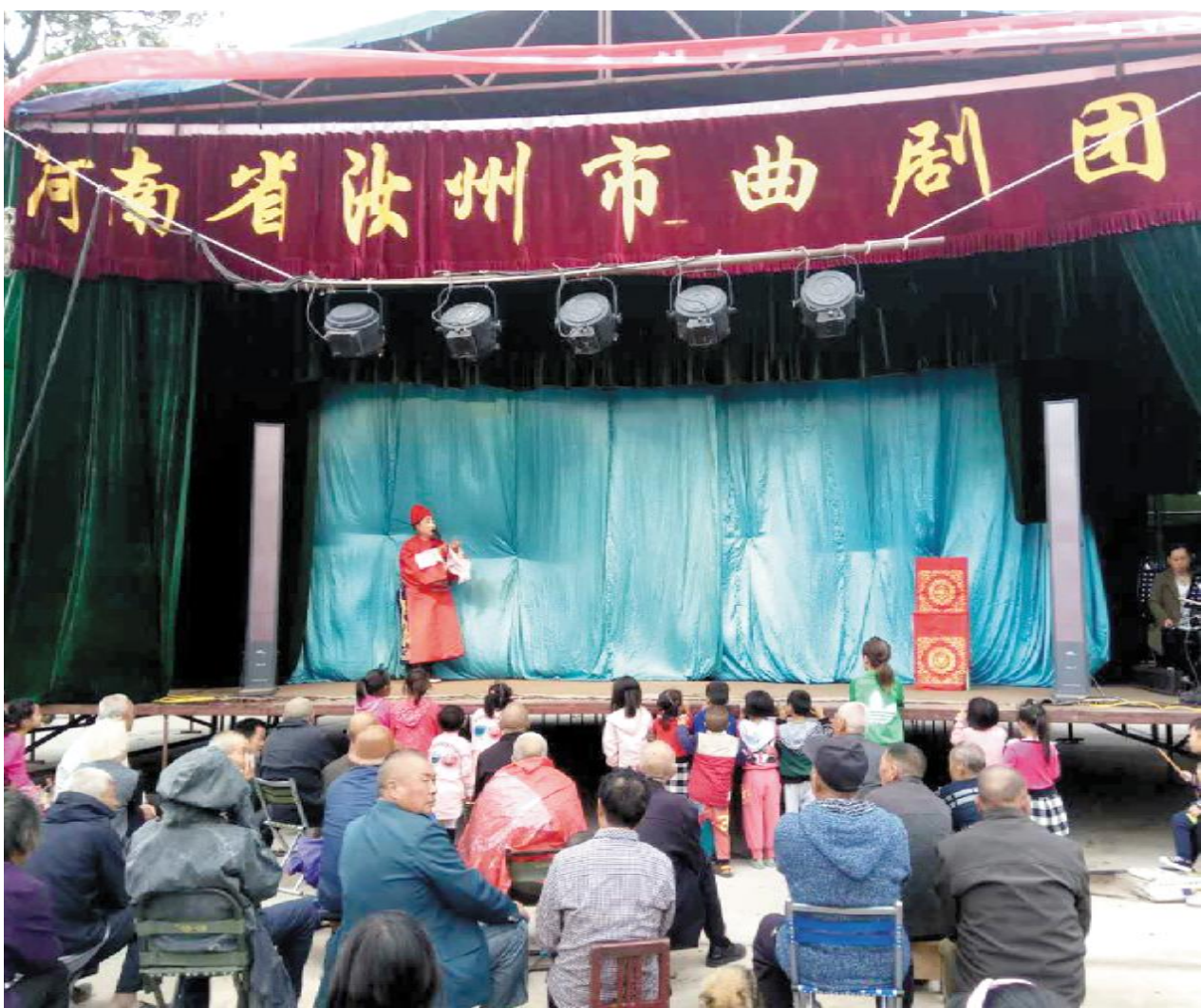
8月29日,市政协驻村扶贫工作队和杜村两委会邀请市曲剧团在焦村镇文化广场举办为期两天的送文化下乡文艺演出,为群众送上了一份精彩的文化大餐,杜村及附近村庄近 1000 人观看了演出。