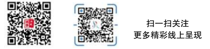
扫一扫关注 更多精彩线上呈现

“作为一名在外打拼的汝州人,我十分关注家乡的发展变化,目前我的公司已经在汝州投资建设了两个项目,包括航模动力机和耳蜗动力机项目,电影《汝海风云》总投资 1 亿元,计划于明年 5 月底前在全国院线上映。目前我也正在积极奔走,希望汝州市与加勒比海小安的列斯群岛上的安提瓜和巴布达国的首都圣约翰市结为友好城市,让汝州大步走向国际舞台。”