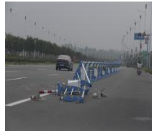
8月1日下午,在广成东路高速路口附近,一段护栏被撞得七零八落。

◆入夏以来,晚上到市体育文化中心乘凉的居民增多,有的带小孩散步,有的玩轮滑、滑板,有的唱歌跳舞。然而广场内外的车辆停放却很混乱,私家车随意摆放,影响市民出入。广场内尽管有电动车的停车位,但是有一些人依然骑着电动车在广场内穿行。