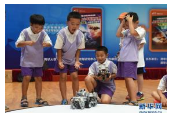
7月20日，小选手在观看自己的机器人比赛。当日，“2017清华少年科学家全国青少年科技大赛”在清华大学附属中学永丰学校拉开帷幕。此次大赛以“外星人入侵”为主题，引中出飞船设计、营造堡垒保卫家园、家园重建、再造动物重建生态等任务。新华社发

据新华社北京7月20日电 国务院近日印发《新一代人工智能发展规划》，提出了面向2030年我国新一代人工智能发展的指导思想、战略目标、重点任务和保障措施，部署构建我国人工智能发展的先发优势，加快建设创新型国家和世界科技强国。 规划明确了我国新一代人工智能发展的战略目标：到2020年，人工智能总体技术和应用与世界先进水平同步，人工智能产业成为新的重要经济增长点，人工智能技术应用成为改善民生的新途径；到2025年，人工智能基础理论实现重大突破，部分技术与应用达到世界领先水平，人工智能成为我国产业升级和经济转型的主要动力，智能社会建设取得积极进展；到2030年，人工智能理论、技术与应用总体达到世界领先水平，成为世界主要人工智能创新中心。