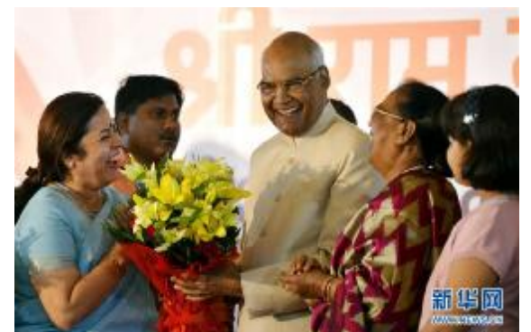
7月20日，印度新当选总统拉姆·纳特·考文德(中)在位于新德里的住所出席庆祝活动。 印度选举委员会20日公布的计票结果显示，全国民主联盟总统候选人拉姆·纳特·考文德当选印度新一任总统。

据新华社北京7月20日电 记者20日从国家税务总局了解到，上半年，全国税务部门共完成税收收入70789亿元，同比增长8.9%，反映出今年以来我国宏观经济稳中向好的发展态势。 据国家税务总局收入核算司副司长郑小英介绍，上半年，我国第二、三产业税收收入均实现较快增长，特别是第二产业税收收入由去年的下降转变为今年上半年较快增长，反映出实体经济好转；第三产业税收收入占全国税收的比重为57.6%，比2016年全年提高1.1个百分点，反映出我国经济结构继续优化。