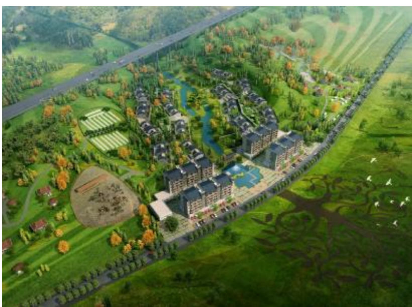
槐树村易地搬迁规划图