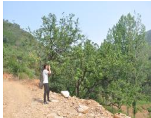
槐树村美景吸引游客驻足拍照