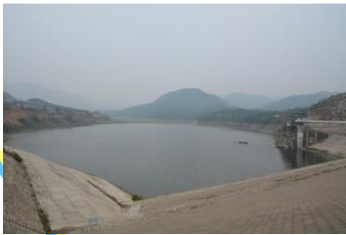
湖光倒影的安沟水库

从市区沿侯线向东行驶20公里,映入眼帘的是一座耸入云天的山峰——鏊铎山,这里山势陡峭,植被茂密,怪石林立,风景如画。山下是黄润河,河中游的安沟水库,库水清澈,青山倒影,鱼伴云游。河岸上有庙,有新植的树林,盛产核桃、杏、柿子,还有大量野生山杏。而在鏊铎山下,在众多美景的包围之中,有一座村庄,长年来,这里的人民在艰苦的环境下辛勤劳作,为了改变她的面貌奋斗不息。她就是槐树村。