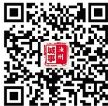
扫一扫关注,更多精彩线上呈现