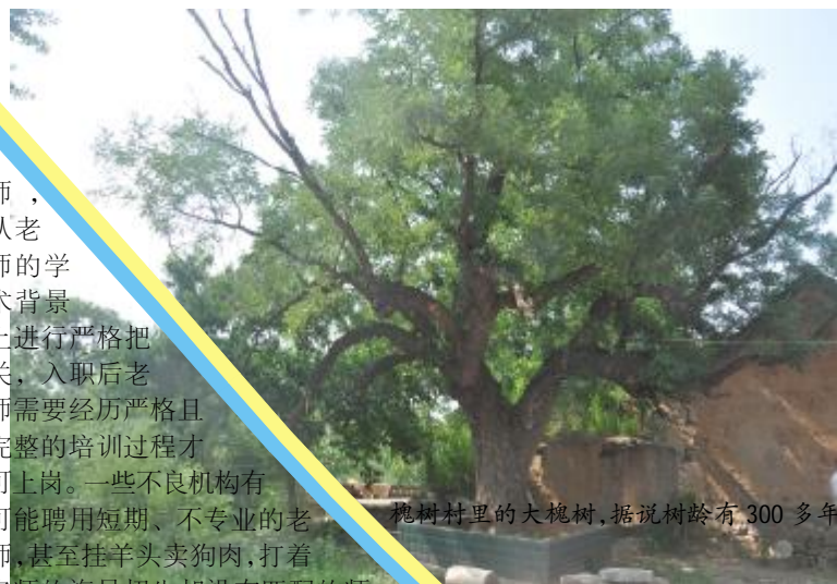
槐树村里的大槐树,据说树龄有300多年