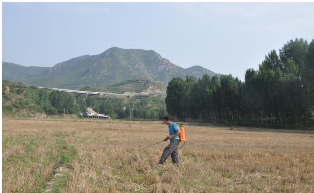
鏊铎山下,农民在辛勤耕作