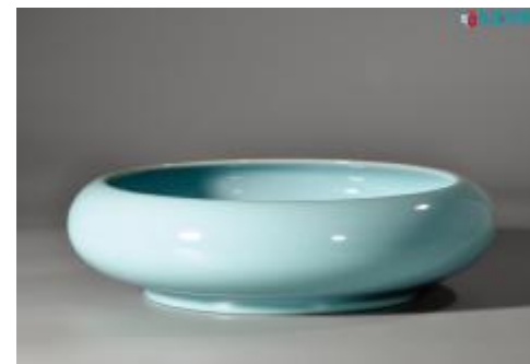
弘宝汝瓷作品 罗汉洗

在宋代,汝瓷的创造意识表现在釉色、造型、工艺技能等方面,如青釉在透明的青玻璃釉基础上发明了天青、天蓝、粉青的乳油釉。其造型上,常参照商周、两汉时期的青铜礼器与玉器的风格,然仿古而不佞古,完全摆脱了青铜礼器的繁琐装饰风格,而形成了不事装饰的极简风格。工艺技法上,多采用模制,体现了严谨与理性。在烧成技法上,改进了窑炉结构。烧成制度上,更加科学精细,已能熟练掌握烧成范围。在审美判断上,已经熟练综合运用多种工艺技法。天青乳油釉的发明和使用,使汝瓷造型的角与点减少了突出感,釉层表面变化更加柔和,更加含蓄,更加内敛,但从内到外又透着一股霸气,一种王者之气。在整体视觉上体现了谐调的格调,凸起角和凹进角同时存在于造型的局部,丰富了视觉效果。如汝瓷典型器型莲花碗等,视觉构成要素直线和曲线的巧妙使用,增强了形式美感。如作品柳条纹钵,造型内部内外面相交接的线,表现了严格的工艺技术,给人以明确和丰富的印象。