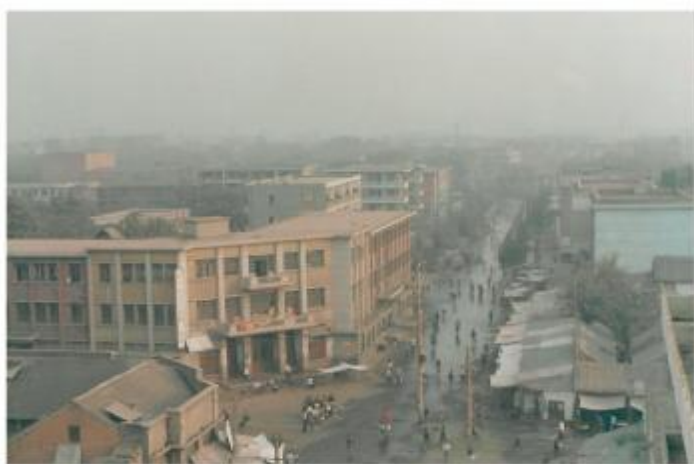
中大街老百货楼路口