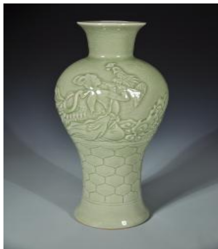
弘宝汝瓷作品 吹箫引凤瓶

什么为孝？“善事父母谓之孝。”孔子进而说，孝最难得是“色难。”也就是说在孝敬父母上，始终和颜悦色是最难的。恰恰在这最难之处韩伯俞做到了。每次当他父母亲打他时，他不躲避，不抵触，没怨言，没怒气，“悦受之”，好让母亲心安理得。此时此刻他还在体察母亲的身体，这种孝行实为“至孝”，是常人难以企及的。韩伯俞的孝行为时人所称道，被后人载入典籍，为世代所传扬。