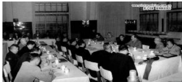
1961年，毛泽东在广州会议上讲解《反对本本主义》