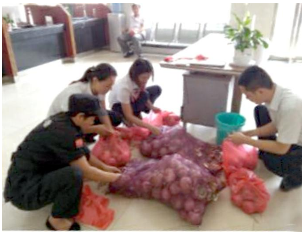
汝州农商银行购买30万斤洋葱解民忧

长期措施包括:一是改善生产条件,错时高效输出。政府进一步加大基础设施建设支持力度,建立冷库,延长蔬菜存放期,缓解产品积压。开辟部分库存作为公益性使用,蔬菜种植