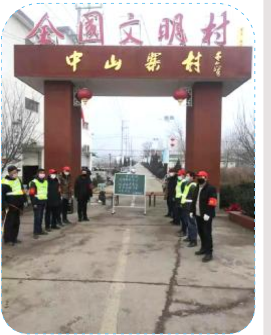
纸坊镇中山寨村守备森严

这是全市人民盼望已久的时刻,也是全体医务人员盼望已久的时刻。对广大市民而言,这无疑是一颗“定心丸”;对众多医务工作者而言,付出终有回报,战“疫”信心百倍。