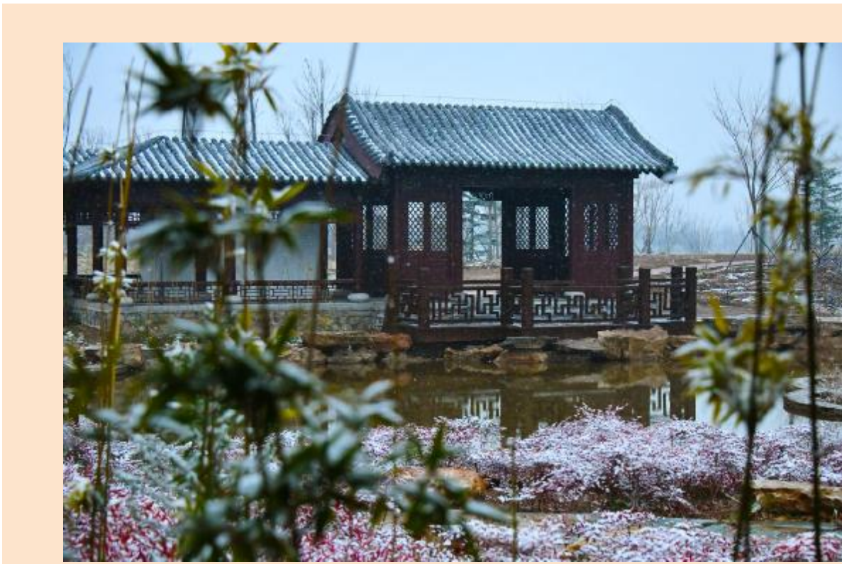
梁杨子近日摄于中央公园牡丹园

景区还有刺激的七彩滑道、步步惊心索桥、扣人心弦的高空5D玻璃桥等精品景点,供游客观赏体验。(黄耀辉)