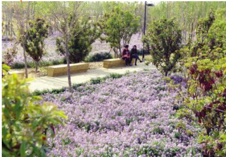
在园中休憩的市民