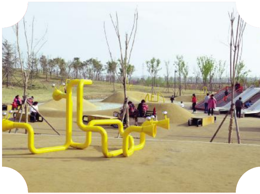
儿童娱乐区游玩的市民