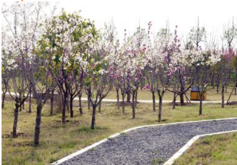
千樱丘内盛开的樱花