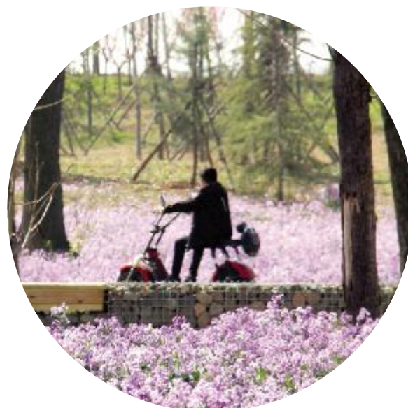
花中游人流连忘返

公园根据外围道路、主园路、现状树林及鱼塘等条件，划分出不同的种植区域，进行特色营造。道路绿化空间为公园北侧邻近滨河大道的种植区域，主要隔离道路对公园的影响，同时形成道路的景观带。选择洋白蜡、国槐、银杏、五角枫、三角枫及雪松、大叶女贞、枇杷等乔木。滨河坡地空间为北汝河大堤堤坡的种植区域，主要选择垂柳、旱柳、山桃、碧桃、海棠等树种，形成桃红柳绿的气氛。湿生种植区围绕保留的鱼塘及其它水系，营造湿生、水生的湖溪氛围。主要选择水杉、枫杨、柳等各类观赏草。生态密林空间结合现状树林的位置，起到围合和分隔为各个园区的功能。疏林草地空间为各个种植区域的过渡空间，游人可在绿地中游憩、休息。