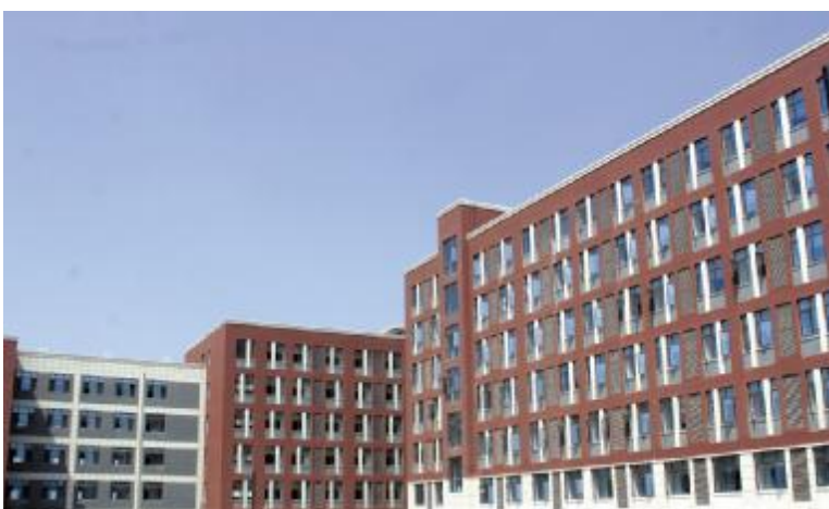
蓝天下的园区教学楼格外壮美