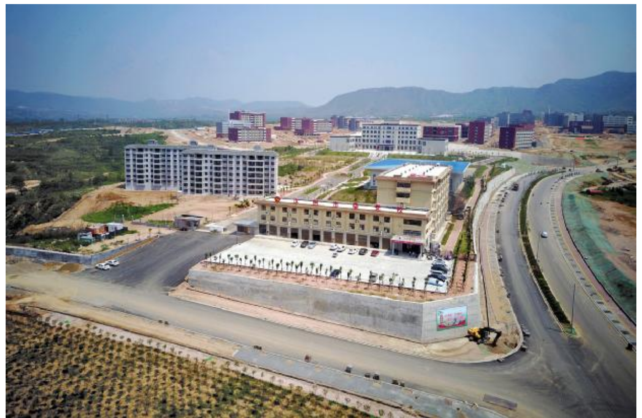
四通八达的园区道路