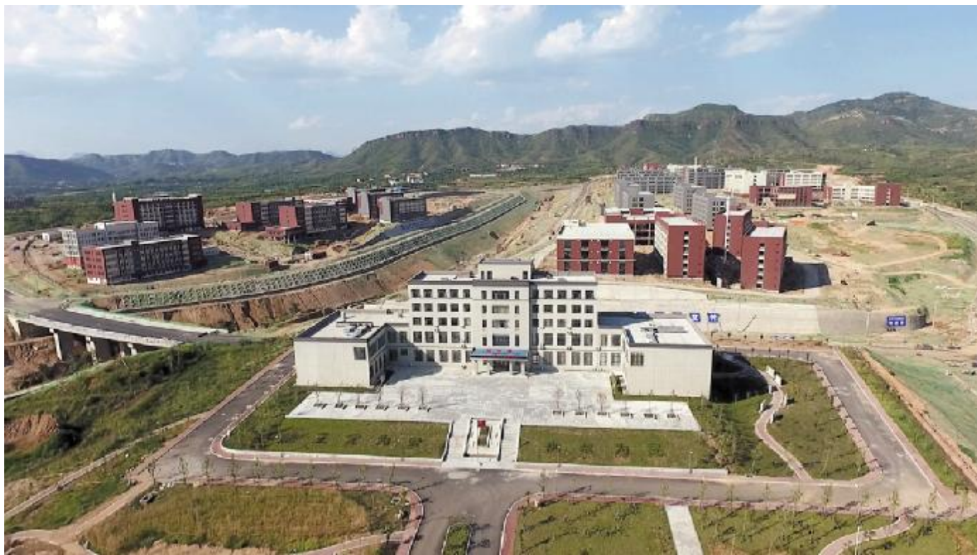
蓬勃崛起的科教园

科教园区以敢叫荒山换新城的气魄在11个月的时间完成了一期项目近50万平方米的建筑施工和将近15公里路网的建设任务,创造了汝州项目建设的奇迹。昔日的荒山,在建设者们“一天也不懈怠,一天也不耽误”战斗斗地的信念感召下,换来了今日的新城新颜。我们相信,在省委、省政府的正确决策下,在汝州市委市政府的坚强领导下,科教园区建设者必将义无反顾,担当奋进,让汝州科教园这朵奇葩绚丽绽放,为建设生态汝州、智慧汝州、健康汝州、文明汝州、幸福汝州作出积极贡献,让汝州在河南复兴的伟大事业征程中更加出彩!